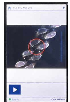
カメラリモーション